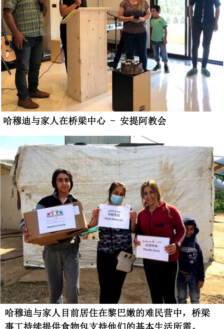
愛，在這裡悄悄連結

黎巴嫩目前確實正推動一項針對敘利亞難民的自願返乡計畫。 在經濟壓力與社會排斥的双重擠壓下，部分家庭選擇返回敘利亞。 然而，這是一個充滿兩難的決定。「自願」返乡的難民不僅面臨敘利亞國內基礎設施的崩壞、基本服務的匱乏（如無水、無電、無工作），甚至有遭受政權報復、暴力、折磨或關押的風險。 這種「返乡-回流」**的現象，生動地揭示了敘利亞重建之路的漫長與艱難，也證明了黎巴嫩雖然困難重重，却仍是許多難民眼中的「安全網」。