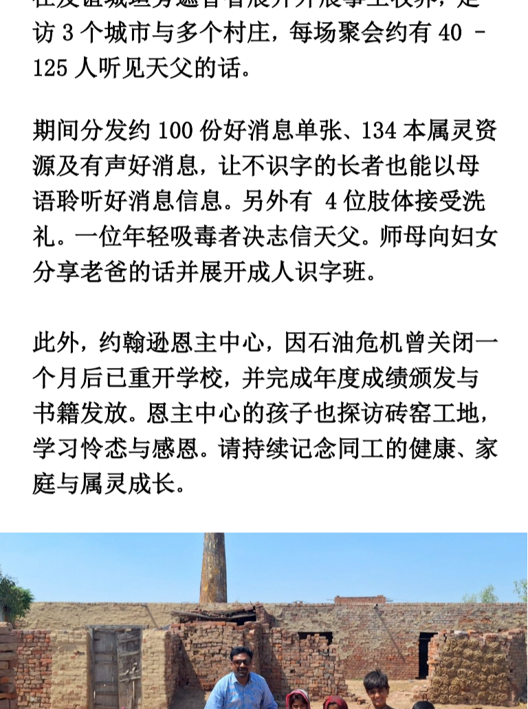
有主就有平安，让我们把心交给祂。

你们看到的每一张照片，都是孩子真实的生活—在恐惧中仍然选择微笑、奔跑、舉手与彼此相爱。中心成为许多家庭的安全之地与希望之光。